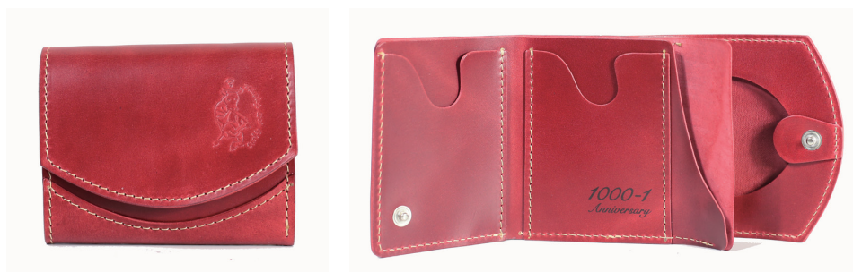
今日の小さいふ。1000色記念モデル最高級馬革コードバン100%「1000anniversary」（限定3個）